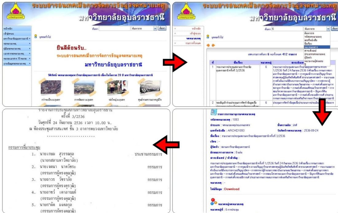
ภาพที่ 3 หน้าจอหลักของระบบสารสนเทศเพื่อการจัดการข้อมูลจดหมายเหตุมหาวิทยาลัยอุบลราชธานี ( http://www.lib.ubu.ac.th/archive_ubu )

ในส่วนของการตกแต่งภาพและไฟล์ข้อมูลในระบบใช้โปรแกรม Adobe Photoshop 7.0 และ Adobe Acrobat 7.0 Professional